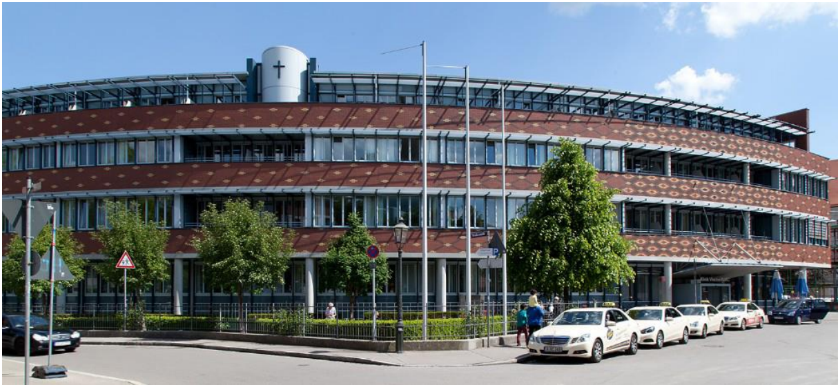
Die Klinik Vincentinum im Herzen der Stadt Augsburg