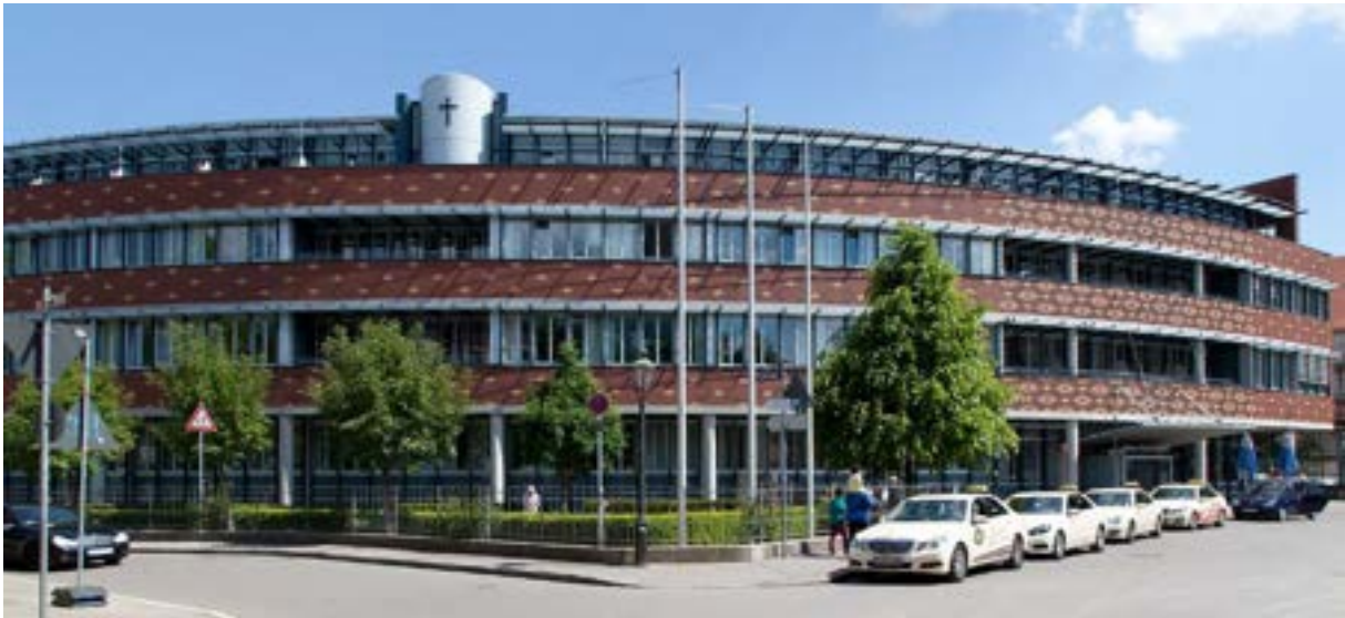
Die Klinik Vincentinum im Herzen der Stadt Augsburg