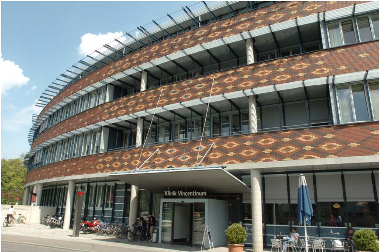
Frontansicht Klinik Vincentinum Augsburg gemeinnützige GmbH